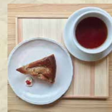
ケーキセット (桃とアーモンドタルトと紅茶) Cake Set

<Notice> Some of restaurants accept CASH ONLY The price including or excluding TAX is depending on the restaurant Some of restaurants require COVER CHARGE Some of restaurants require to order at least ONE DRINK