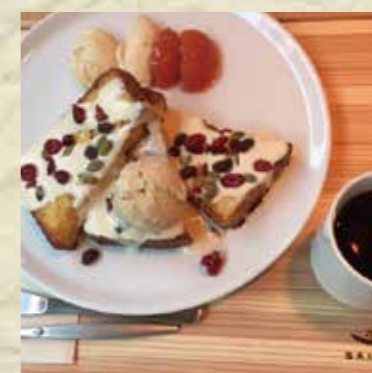
サイラムフレンチトースト Sairam French toast