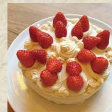
季節のフルーツショートケーキ Seasonal Fruit Sponge cake