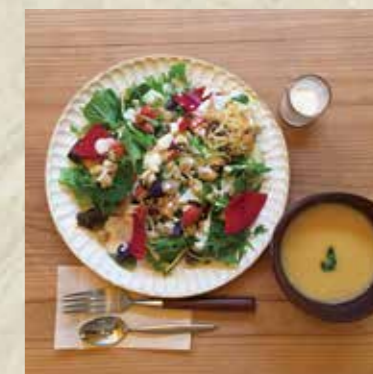
コブサラダ Cobb salad